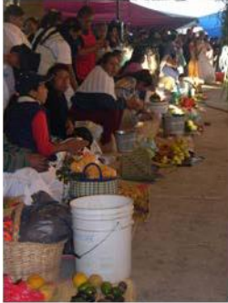
Trueque en Zacualpan de Amilpas