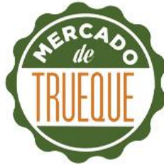
Trueque en Ciudad de México